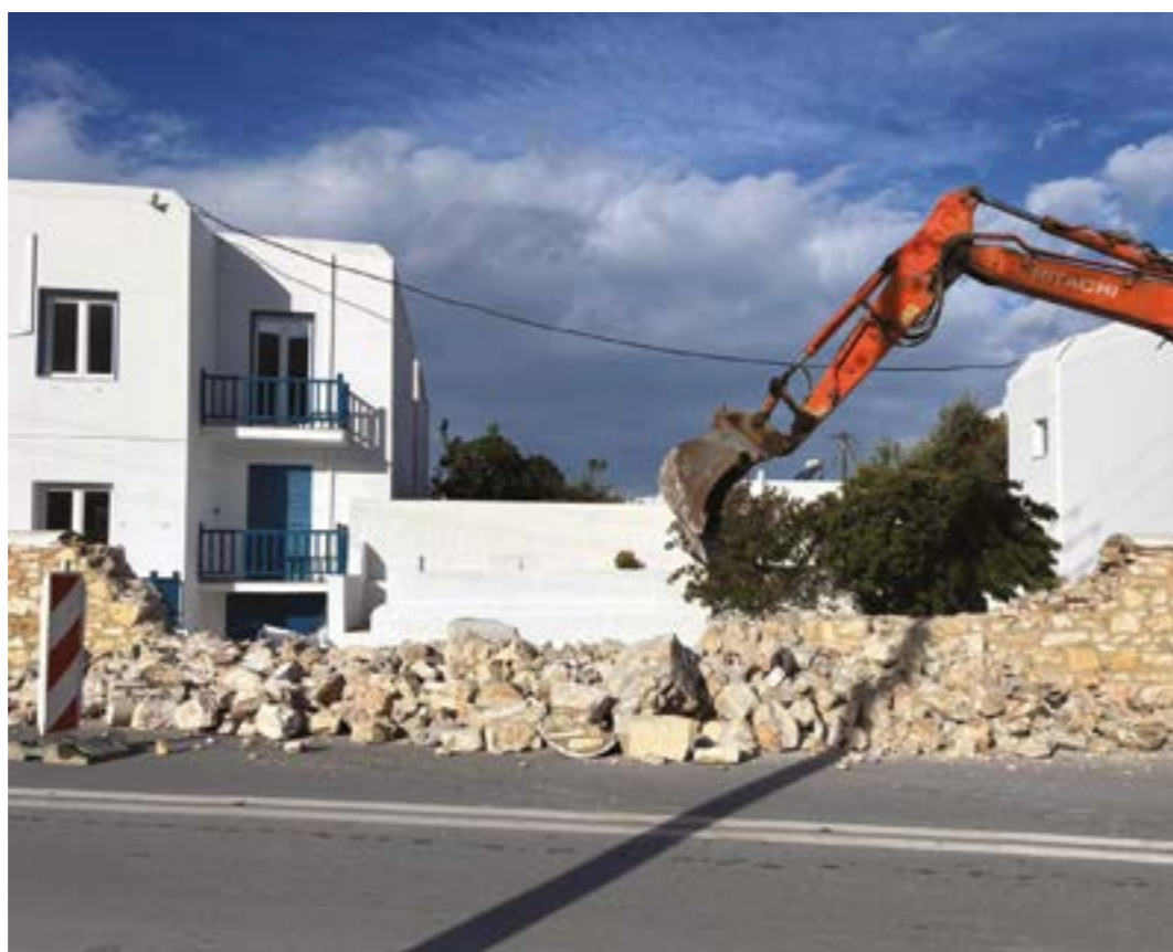
Δίκως περαιτέρω σχολιασμό, ξεκίνησε στην Πάρο το γκρέμιμα του... «τείχους του Βερολίνου»

✓ Κι εδώ να πούμε και τα «φρέσκα κουλούρια» με τη δικαίωση της ΚΕΔΕ (κερδίζει ήδη με 1-0 τις κυβερνητικές αποφάσεις) στο Συμβούλιο της Επικρατείας, καθώς κρίθηκαν αντισυνταγματικές οι προσαυξήσεις των όρων δόμησης (μπόνους) με αντιτάθμισμα την ενεργειακή αναβάθμιση των κτηρίων, όπως προέβλεπε ο Νέος Οικοδομικός Κανονισμός... Και μάλιστα όπως τόνισε ο πρόεδρος της ΚΕΔΕ, η ανακοίνωση του ΣτΕ αποτελεί πλήρη δικαίωση των θέσεων και των αγώνων της αυτοδιοίκησης στην προστασία της φυσιογνωμίας των πόλεων