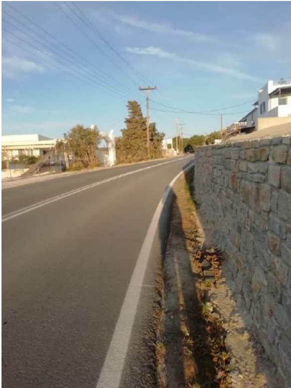
Φωτό 4: Το ανύπαρκτο πεζοδρόμιο που θα χρησιμοποιούν τα παιδιά για τη μετάβασή τους από και προς το Ωδείο!

Εφόσον βρίσκεται σε επαρχιακό δρόμο χρειάζεται άδεια εισόδου-εξόδου, σύμφωνα με το Βασιλικό διάταγμα 465/70, Άρθρο 39.