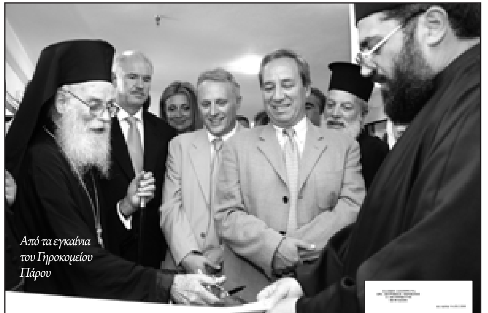
Από τα εγκαίνια του Γηροκομείου Πάρου

Η ανάδειξη του Ενοριακού Ναού της Εκατονταπυλιανής σε Προσκύνημα, η πανελλήνια εμβέλεια του, ο εορτασμός για τους 17 αιώνες του